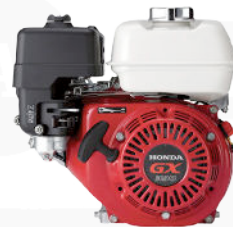
MOTOR A GASOLINA